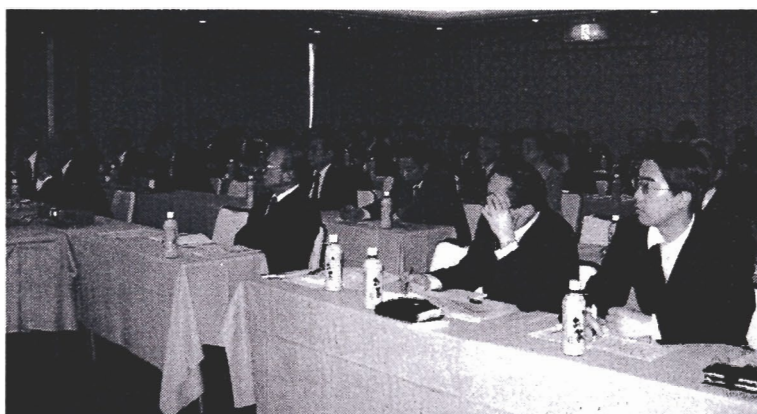
当協会情報システム委員会主催の「オンライン書店セブンアンドワイの売り方」講演会風景