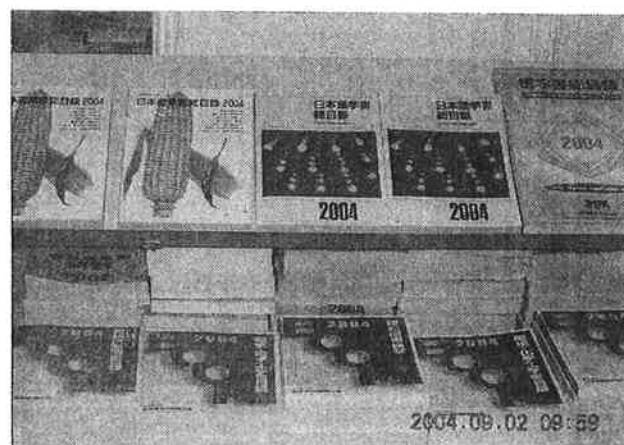
日本事務局での自然科学書協会関連分野の目録展示の様子