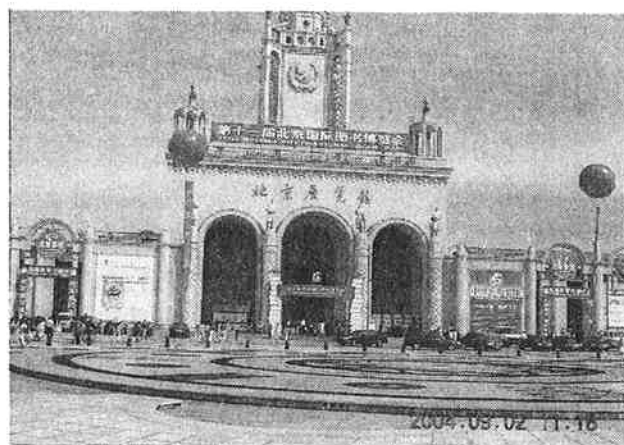
第11回北京国際図書展示会の会場となった北京展覧館の入口